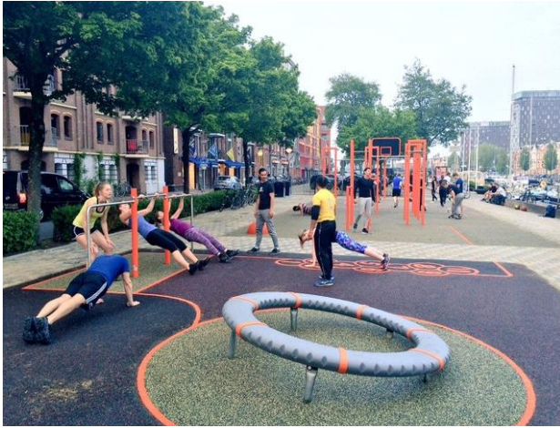
Sport- en speelplek Oosterkade in gebruik, juni 2016