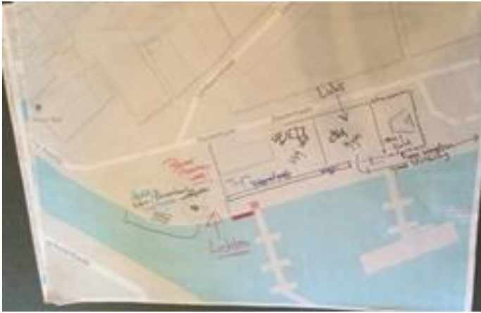
Uitwerking ideeën (groep 1), oktober 2015