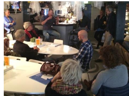
Bijeenkomst Oosterkade, oktober 2015

De Oosterkade met en voor de bewoners en andere stakeholders als een inspirerende en vernieuwende plek inrichten voor jong en oud die daadwerkelijk uitnodigt om te sporten, spelen en elkaar te ontmoeten.