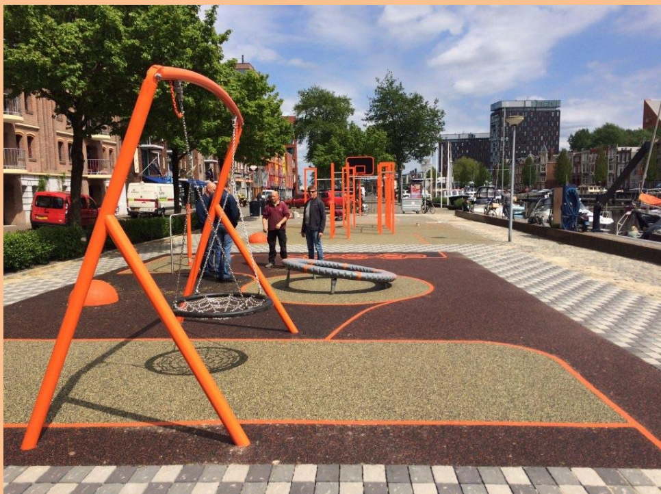
Eindresultaat sport- en speelplek Oosterkade, juni 2015