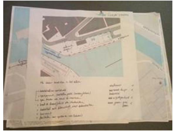
Uitwerking ideeën (groep 2), november 2015