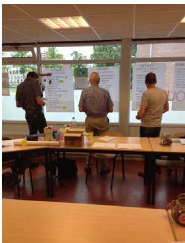
Bijeenkomst organisaties, juni 2015