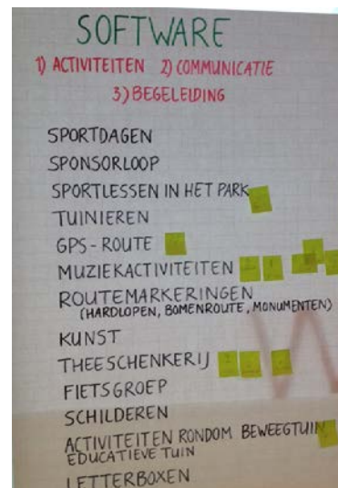
Prioritering activiteiten (software), juni 2015